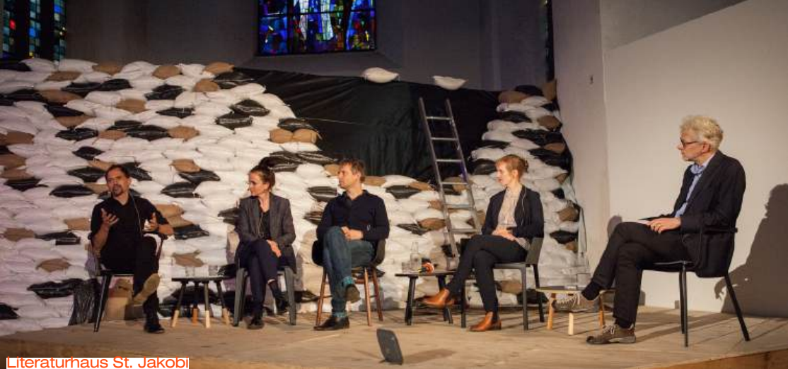
Literaturhaus St. Jakob