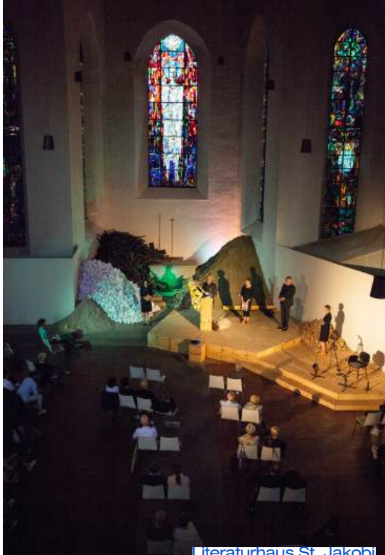
Literaturhaus St. Jakobi