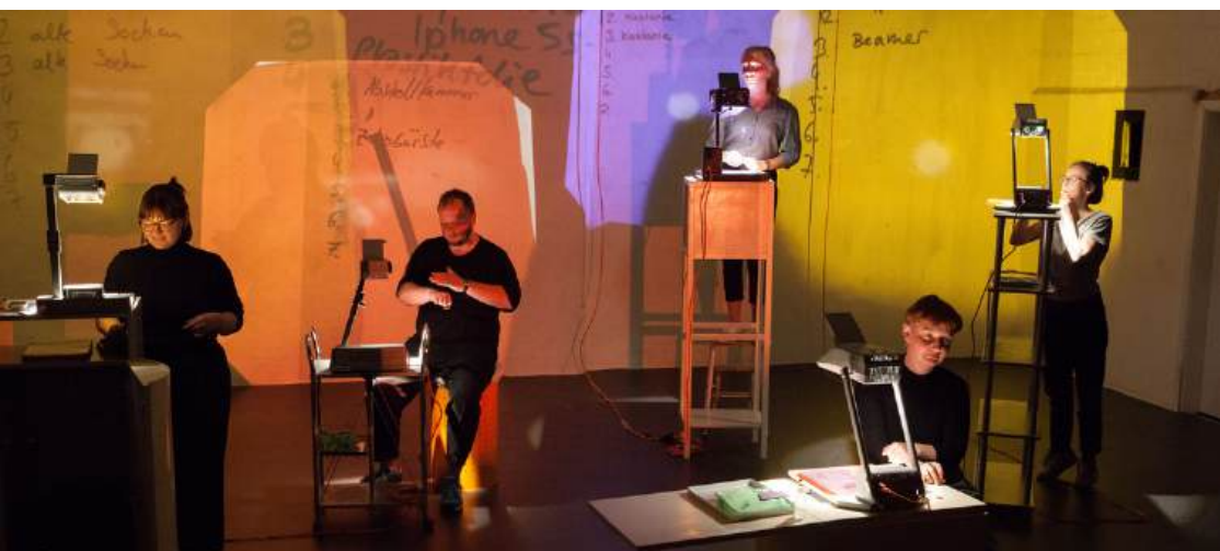
tait Theaterhaus Hildesheim