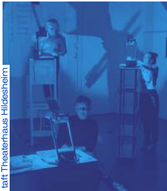
taft Theaterhaus Hildesheim