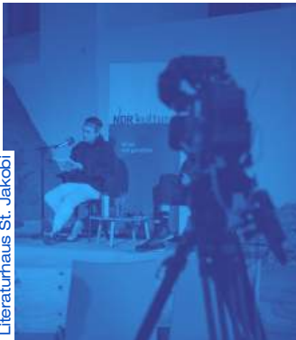
Literaturhaus St. Jakobi

Bei Fragen zu Leistungsangebot und Preisgestaltung finden Sie detaillierte Informationen auf dem angehängten Blatt Angebot Dokumentation Kultur . Gerne begleite ich auch Ihre nächste Veranstaltung.